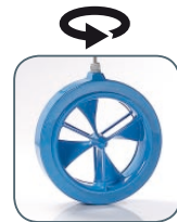
Prop-eye 265, ausfahrbares, drehbares Heckstrahlruder